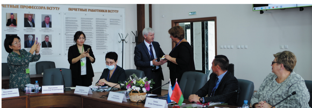
В оргкомитете конференции