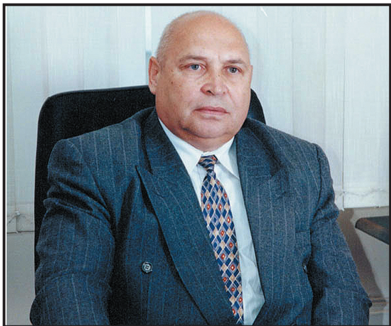
Профессор Ю.М. Максимовский