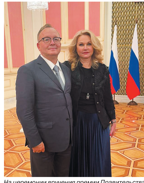
На церемонии вручения премии Правительства РФ. О.О. Янушевич и Т.А. Голикова